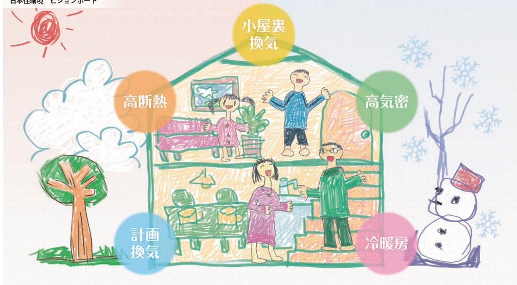
日本住環境 ビジョンボード

高性能な戸建住宅では夏の暑い日も冬の寒い日も室温はどこにいても一定です。快適な住環境は住む人の笑顔や健康をつくります。下のビジョンボードのように家族みんながニコニコ笑顔になる住宅、これを日本中に広めるのが当社の使命であり存在理由です。